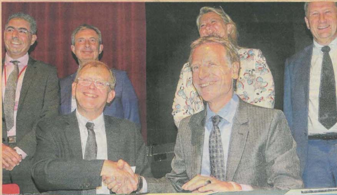
Le rapprochement entre l'enseignement supérieur et l'entreprise est une condition indévitable à l'innovation.