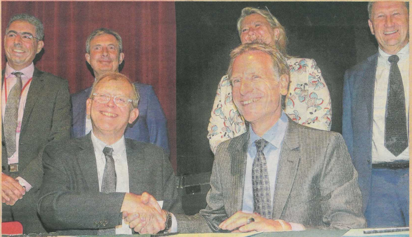
Le rapprochement entre l'enseignement supérieur et l'entreprise est une condition inévitable à l'innovation.